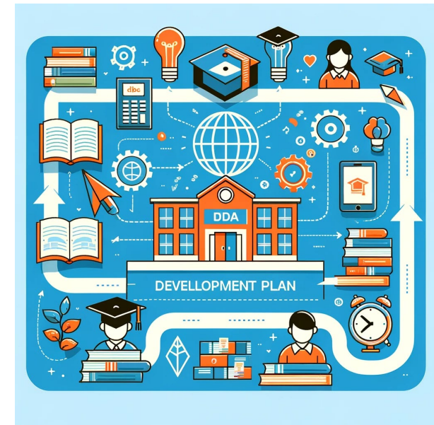
Razvojni načrt