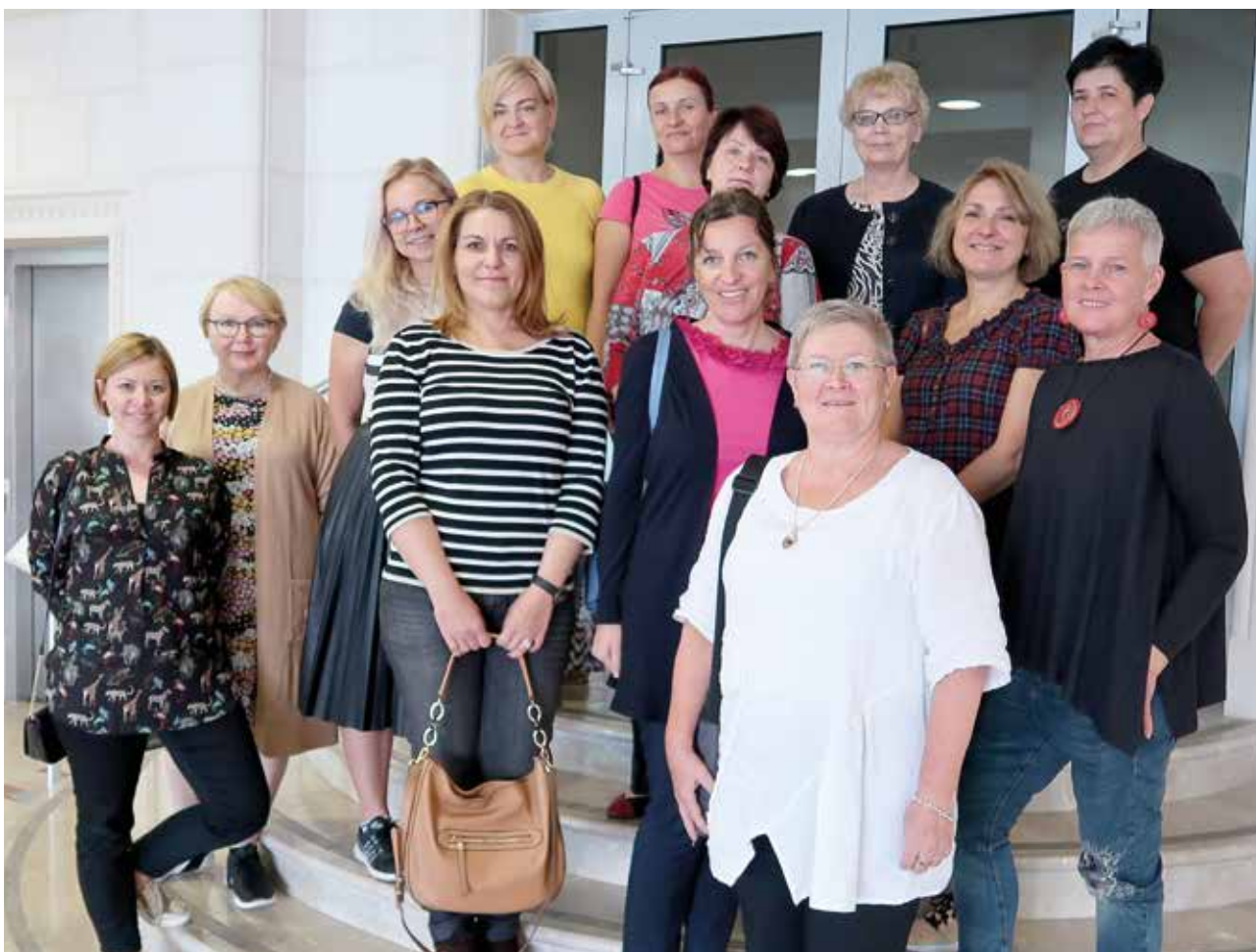
Slika 7: Na enem izmed sestankov, namenjenih razvoju Evropskih kazalnikov za kolegialno presojo kakovosti izvajalcev PSI v Splitu, septembra 2019.