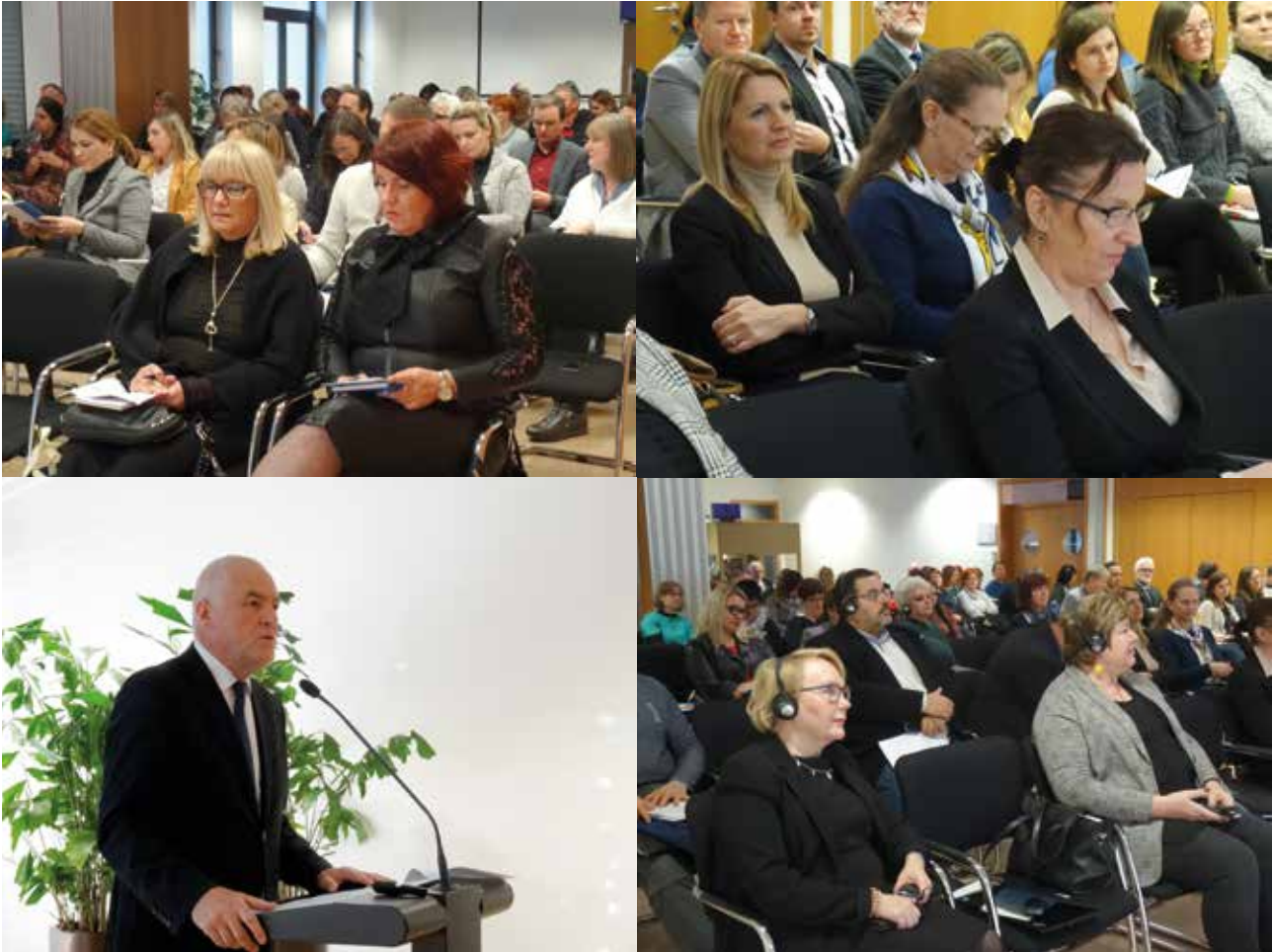
Slika 8: Konferenca Kakovost poklicnega in strokovnega izobraževanja 2019/2020.