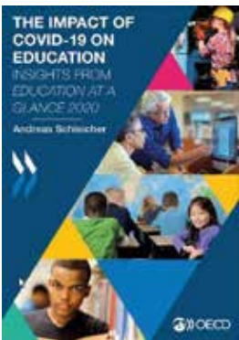
Slika 1: Raziskava OECD-ja o vplivu pandemije na izobraževanje.

V letu 2020 smo se na področju izobraževanja tako v Sloveniji kot tudi na evropski in svetovni ravni prioritarno ukvarjali z raziskovanjem kakovosti izobraževanja na daljavo za različne generacije učencev.