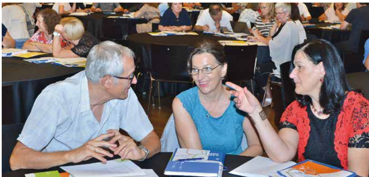
Slika 4: Na zaključni konferenci Skupaj gradimo kakovost , avgusta 2019 na Brdu, kjer je bila predstavljena zbirka Kakovost v vrtcu in šoli , ki je dostopna na spletni strani Konferenca Skupaj gradimo kakovost – Šola za ravnatelje (solazaravnatelje.si) .