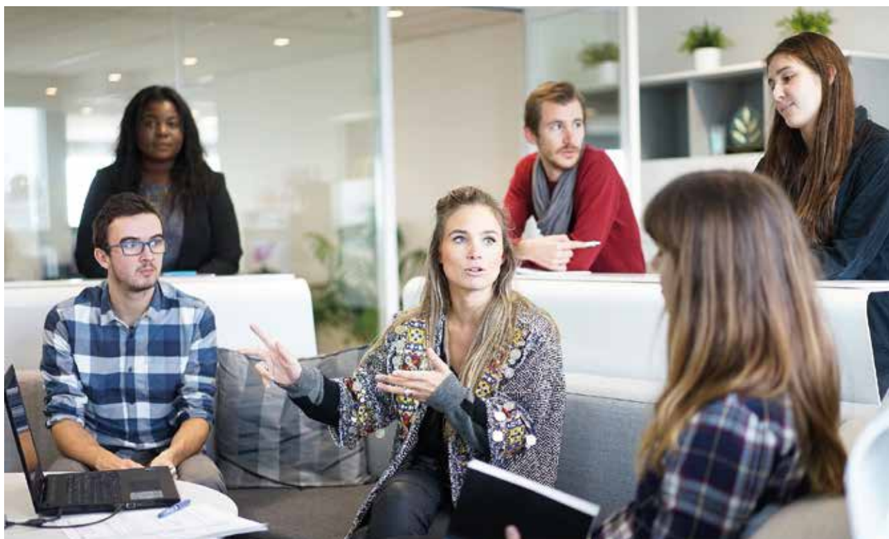
Slika 5: Raziskovanje povezave med izobraževanjem in karierno potjo absolventov bo tudi v naslednjih desetih letih eno izmed prioritetenih izhodišč razvoja poklicnega in strokovnega izobraževanja v Evropi.