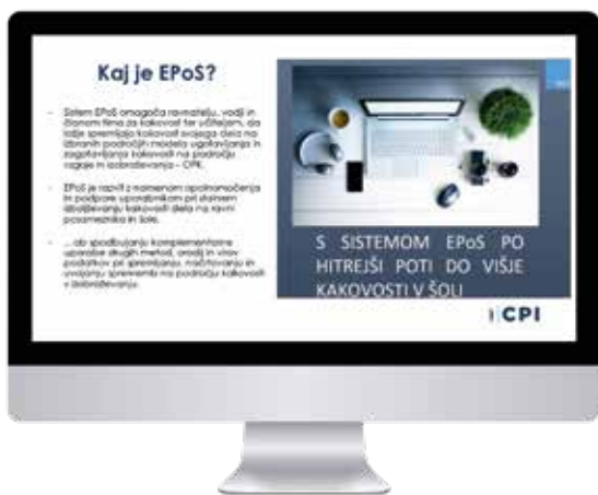
Slika 2: Predstavitev in umestitev spletnega anketiranja EPoS v širši okvir UZK na šoli – uvodni diapozitiv z usposabljanja.

Februarja 2021 smo z ožjo delovno skupino EPoS, ki je medinstitucionalno strukturirana, začeli že četrto zaporedno spletno anketiranje EPoS, ki poteka vsaki dve leti. V letu 2021 se je v spletno anketiranje EPoS ponovno vključila dobra četrtina srednjih poklicnih in strokovnih šol.