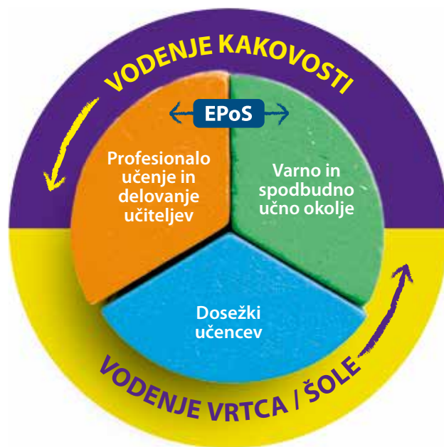
Slika 3: S spletnim anketiranjem EPoS si lahko šola pomaga pri samoevalvaciji v povezavi z dvema področjema kakovosti zbirke Kakovost v vrtcih in šolah .

V letu 2021 se je v spletno anketiranje EPoS ponovno vključila dobra četrtina srednjih poklicnih in strokovnih šol. Ker pa namen anketiranja ni anketiranje samo, pač pa objektivni vpogled v stanje na izbranih področjih kakovosti tako na ravni učitelja kot na ravni šole ter kasnejše načrtovanje in uvajanje izboljšav, smo v letu 2021 pripravili dve usposabljanji v podporo spletnemu anketiranju EPoS. Usposabljanji sta namenjeni ravnateljem ter vodjem in članom timov za kakovost, ki kolektiv seznanijo z namenom anketiranja, organizirajo spletno anketiranje na šoli in ga umestijo v širši okvir kakovosti šole. Po prejemu izpisa rezultatov na šoli vodijo kasneje tudi diskusije o samoevalvacijskih ugotovitvah, načrtovanje in uvajanje izboljšav na šoli ter kasnejše spremljanje uvajanja izboljšav in njihovih učinkov na ravni šole. Ravnatelj in tim za kakovost zato prejmeta izpis rezultatov