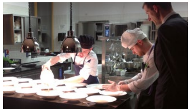
Dijaki BIC Ljubljana ob pripravi večerje