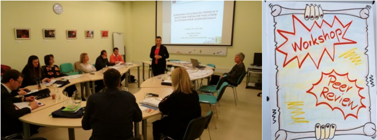
Skupno usposabljanje vodstva in tima za kakovost presojane šole ter tima presojevalcev

Kot nacionalna referenčna točka EQAVET NRP v Sloveniji srednjim poklicnim in strokovnim šolam ponujamo kolegialno presojo kakovosti. Presoja poteka po kazalnikih kakovosti, usmerjenih na posebnosti poklicnega izobraževanja, ki smo jih razvili v evropski mreži za kakovost poklicnega in strokovnega izobraževanja.