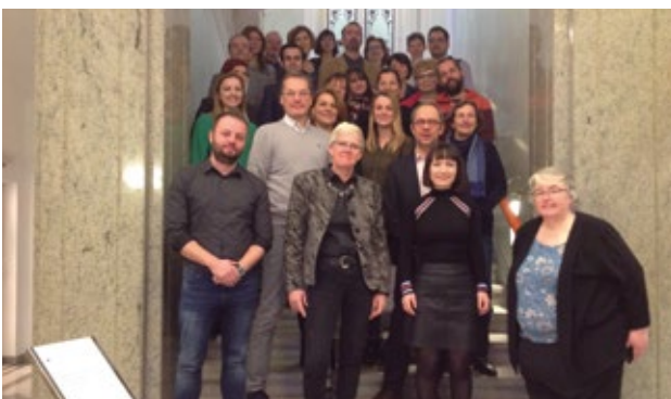
Predstavniki nacionalnih referenčnih točk mreže EQAVET, ki so se udeležili dogodka

Več o rezultatih dogodka na: http://www.eqavet-nrp-slo.si/gradiva/ .