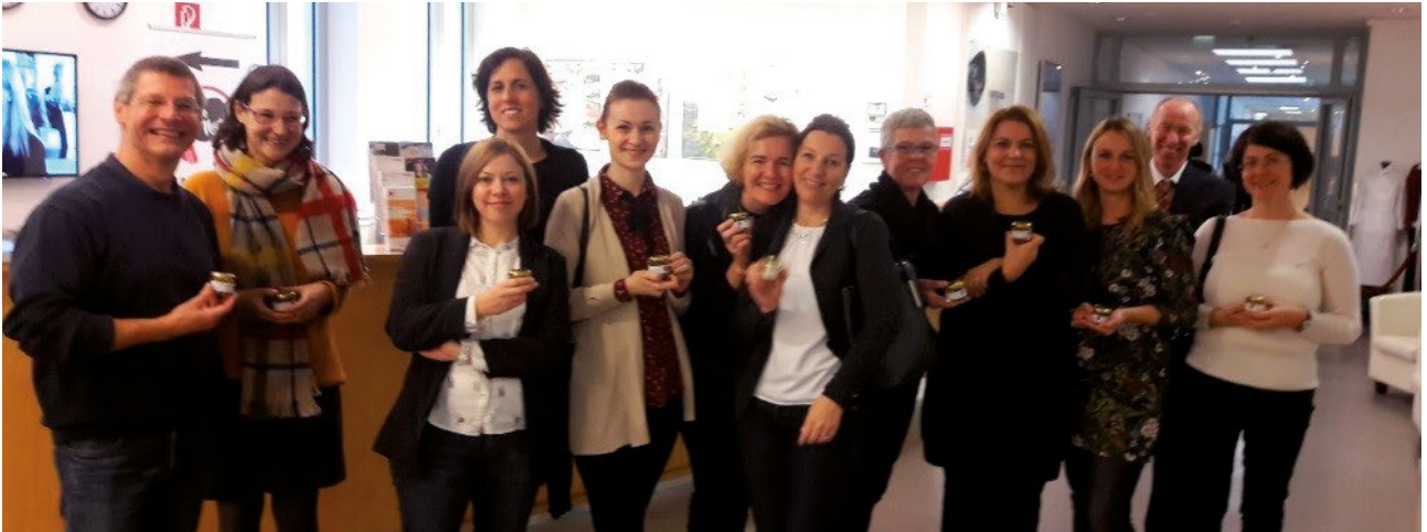
Študijski obisk na Dunaju – šola Tourismus Schulle Neue Wassermannngasse

Evropske nacionalne referenčne točke za kakovost poklicnega izobraževanja in usposabljanja se medsebojno povežemo za namene skupnega razvojnega dela ter medsebojnega učenja.