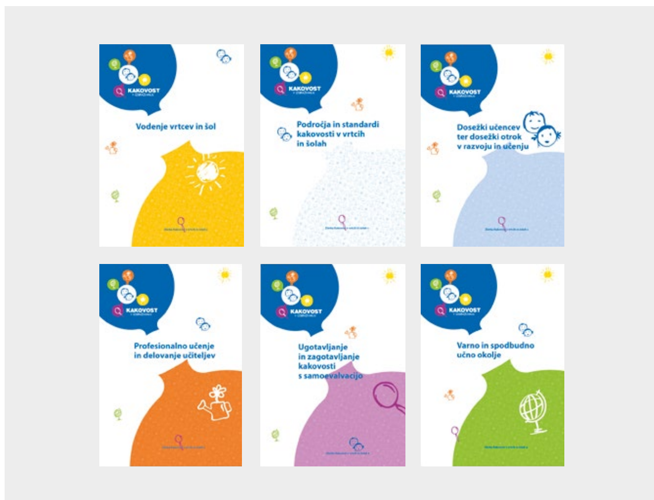
Zbirka Kakovost v vrtcih in šolah

Mreženje za kakovost , ki je bilo vzpostavljeno in vodeno v programu OPK kot oblika profesionalnega učenja, je vsakemu sodelujočemu vrtcu in šoli omogočilo, da se je udeležil šestih mreženj. Cilj teh mreženj ni bil le preizkušanje različnih elementov modela ugotavljanja in zagotavljanja kakovosti (kot so npr. standardi in kazalniki s področja učenja in poučevanja, proces vodenja kakovosti, različne oblike mreženj), temveč tudi prepoznavanje raznolikosti vodenja procesa kakovosti v praksi ter izmenjava izkušenj in praks med sodelujočimi šolami in vrtci.