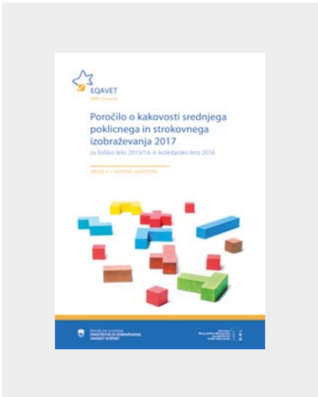
Poročilo o kakovosti srednjega poklicnega in strokovnega izobraževanja za leto 2017

EQAVET NRP v Sloveniji na Centru RS za poklicno izobraževanje koordinira pripravo Nacionalnega poročila o kakovosti sistema poklicnega in strokovnega izobraževanja (PSI), ki ga pripravljamo vsake tri leta, in objavljamo na spletnih straneh Centra ter nacionalne referenčne točke: http://www.eqavet-nrp-slo.si/gradiva/ . Njegova vrednost za izobraževalni sistem je predvsem v tem, da lahko služi kot eden izmed strokovnih virov za sprejemanje na dokazih temelječih dolgoročnih odločitev v izobraževalni politiki.